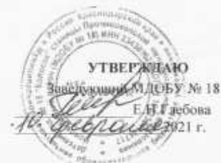
Карточка ПСР-проекта «Оптимизация процесса сбора информации о посещаемости и заболеваемости воспитанников ДОУ »